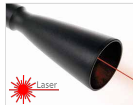
Modul pro velký dosah