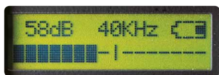
Kalibrovaná stupnice v decibelech podle NIST

Ultraprobe® 9000 je mnohostranný digitální ultrazvukový kontrolní, informační a paměťový, jehož užívání je snadné (většina techniků se ovládání naučí do 15 minut!). Ultraprobe® vám umožní rychlou diagnostiku. Data lze snadno prohlížet na displeji a stisknutím tlačítka ukládat do paměti jak při vyhledávání a odstraňování problémů, tak při předem plánované údržbě.