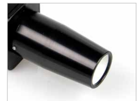
Modul pro zaměření na blízko