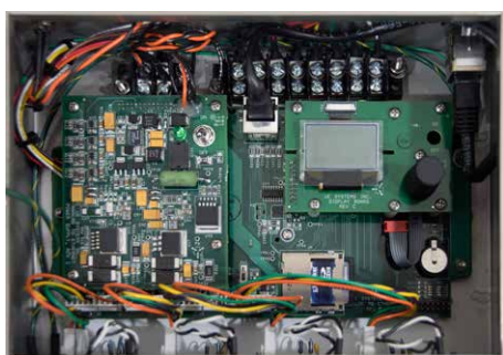
UE 4Cast: caja de circuitos abierta

Cada caja 4Cast es capaz de monitorizar hasta 4 rodamientos al mismo tiempo.