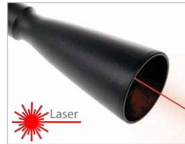
Módulo de largo alcance