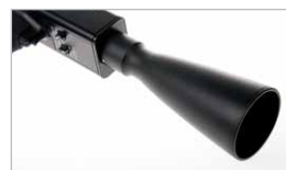
Módulo largo alcance