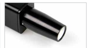
Módulo de enfoque cercano