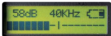
Scala calibrata in dB riconducibile a NIST

Ultraprobe® 9000 è un sistema di ispezione ultrasonico digitale di nuova concezione. Consente di rilevare, analizzare e memorizzare i dati in modo efficace ed efficiente. Semplice e robusto, non richiede più di 15 minuti di istruzione per essere reso operativo alla maggior parte degli utilizzatori. Questo Ultraprobe® vi permetterà di spaziare tra le più varie applicazioni in modo facile e veloce. Infatti che venga utilizzato per la risoluzione di problemi improvvisi, come per effettuare indagini pianificate, i dati risulteranno sempre facilmente utilizzabili ed immediatamente memorizzabili con la sola pressione di un unico tasto.