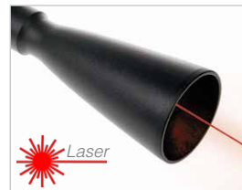
Modul med lång räckvidd