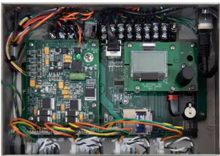
UE 4Cast açık kutu devresi