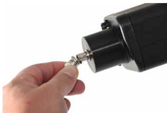
Basamak 3 - Ultraprobe'ü kutuya bağlayın