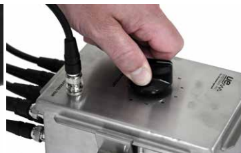
Basamak 4 - Noktalar arasında geçiş yapın ve verilerinizi okuyun