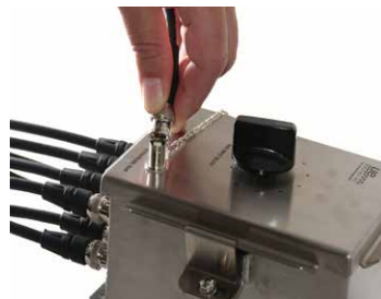
Basamak 2 - Sensörleri