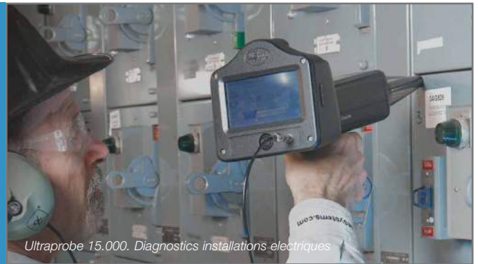
Ultraprobe 15.000. Diagnostics installations électriques