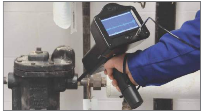
Ultraprobe 15.000. Detection de fuite internes