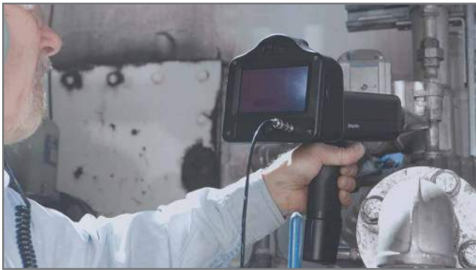
Ultraprobe 15.000. Detection de fuite externes