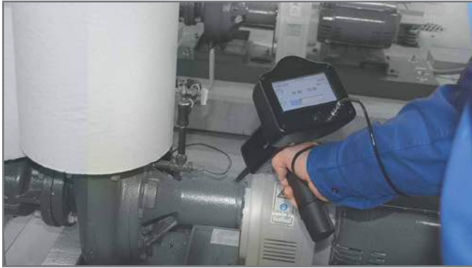
Ultraprobe 15.000. Diagnostics machines tournantes