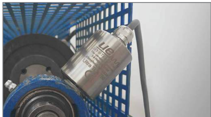
Ultra-Trak 750. Surveillance permanente