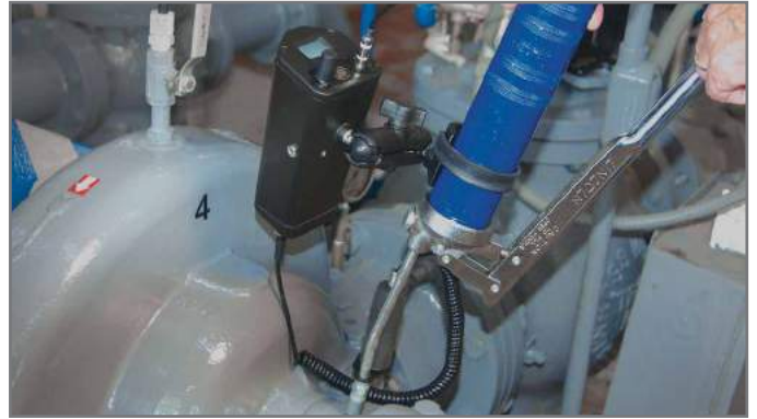
Ultraprobe 401. Graissage Intelligent