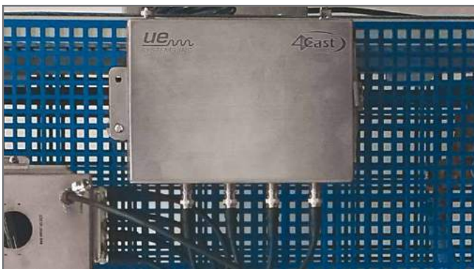
4Cast. Surveillance permanente