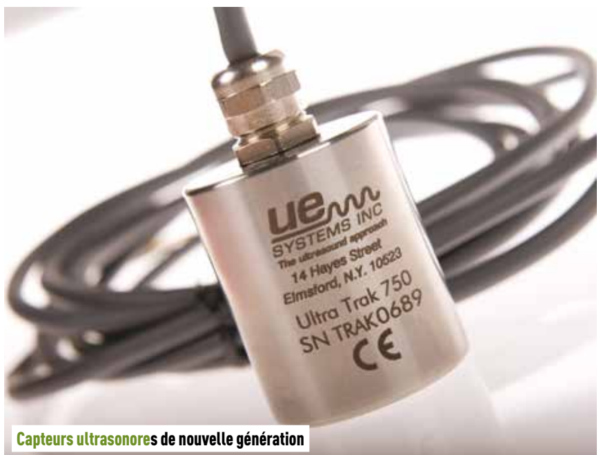
Capteurs ultrasonores de nouvelle génération

Il y a peu de limitations à la mise en place de surveillance à distance par ultrasons. Toutes les situations où des diagnostics ultrasonores manuels sont effectués peuvent